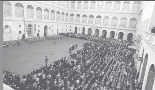
1 Sandro Hildbrand