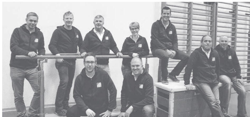
Das OK des Oberwalliser Turnfestes 2016.

Die Turnaktivitäten werden durch ein abwechslungsreiches Rahmenprogramm abgerundet. Der Walliser Kult-Unterhalter z'Hansrüedi wird für Stimmung sorgen, ebenso Queen-Legend, eine englische Queen-Cover-Band der Extraklasse. Mit DJ Mike konnte zudem ein angesagter Partymacher verpflichtet werden. Weiter wird ein reichhaltiges kulinarisches Angebot präsentiert und ein Funpark garantiert für Spass und Spannung für Gross und Klein. Am Start ist zudem die Artistengruppe Konterschwing, die mit ihren akrobatischen Barrenübungen das Publikum in bester Art und Weise unterhalten wird.