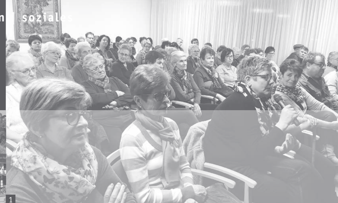
1 Teilnehmer der Infoveranstaltung