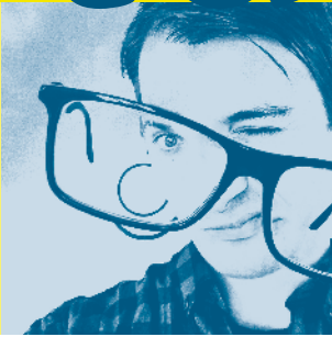
Cartoon Gabriel Giger