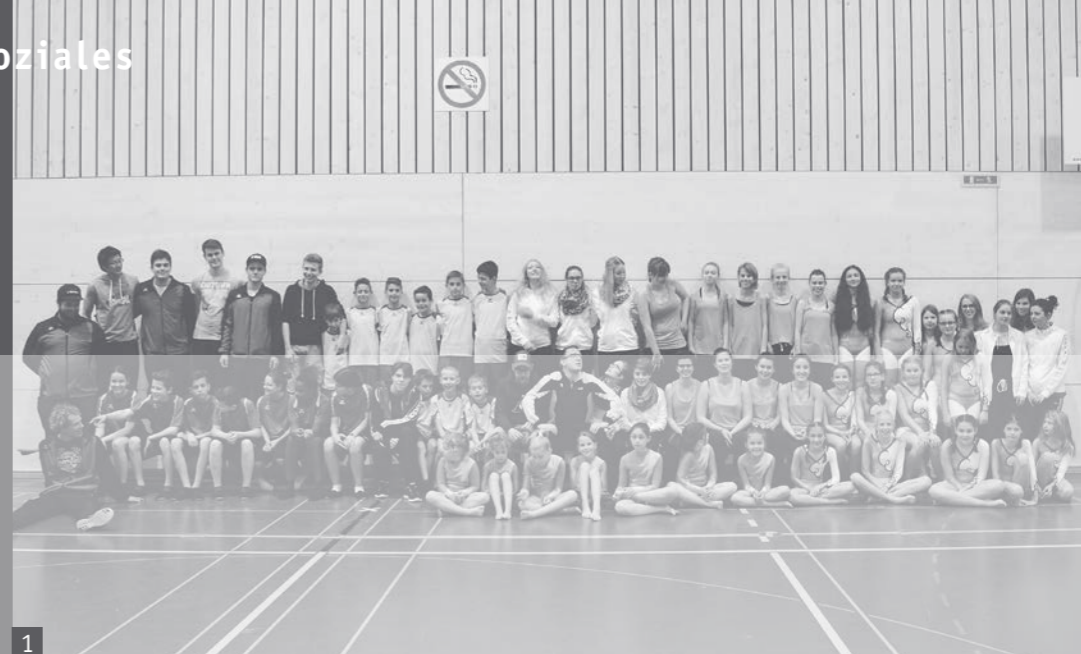
1 Teilnehmer des Jugendriegelagers 2016