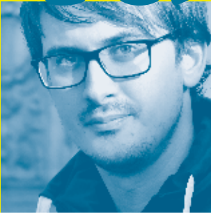
Cartoon Gabriel Giger